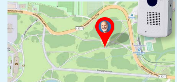
Bildquelle: „Baskarte und Daten von OpenStreetMap und OpenStreetMap Foundation“

Monatlicher Preis: 63,50 € Einmalige Anschlussgebühr: 0,00 €